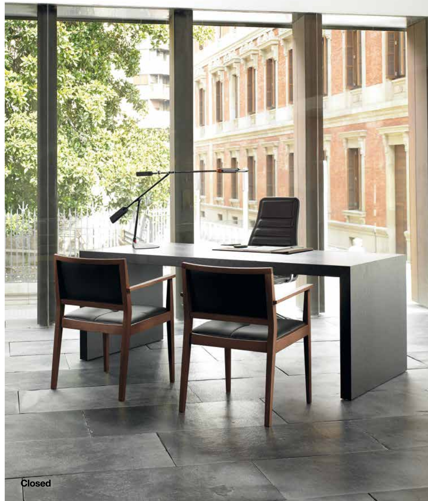
Table with solid oak wood top and legs. Mesa con sobre y patas de madera de roble.