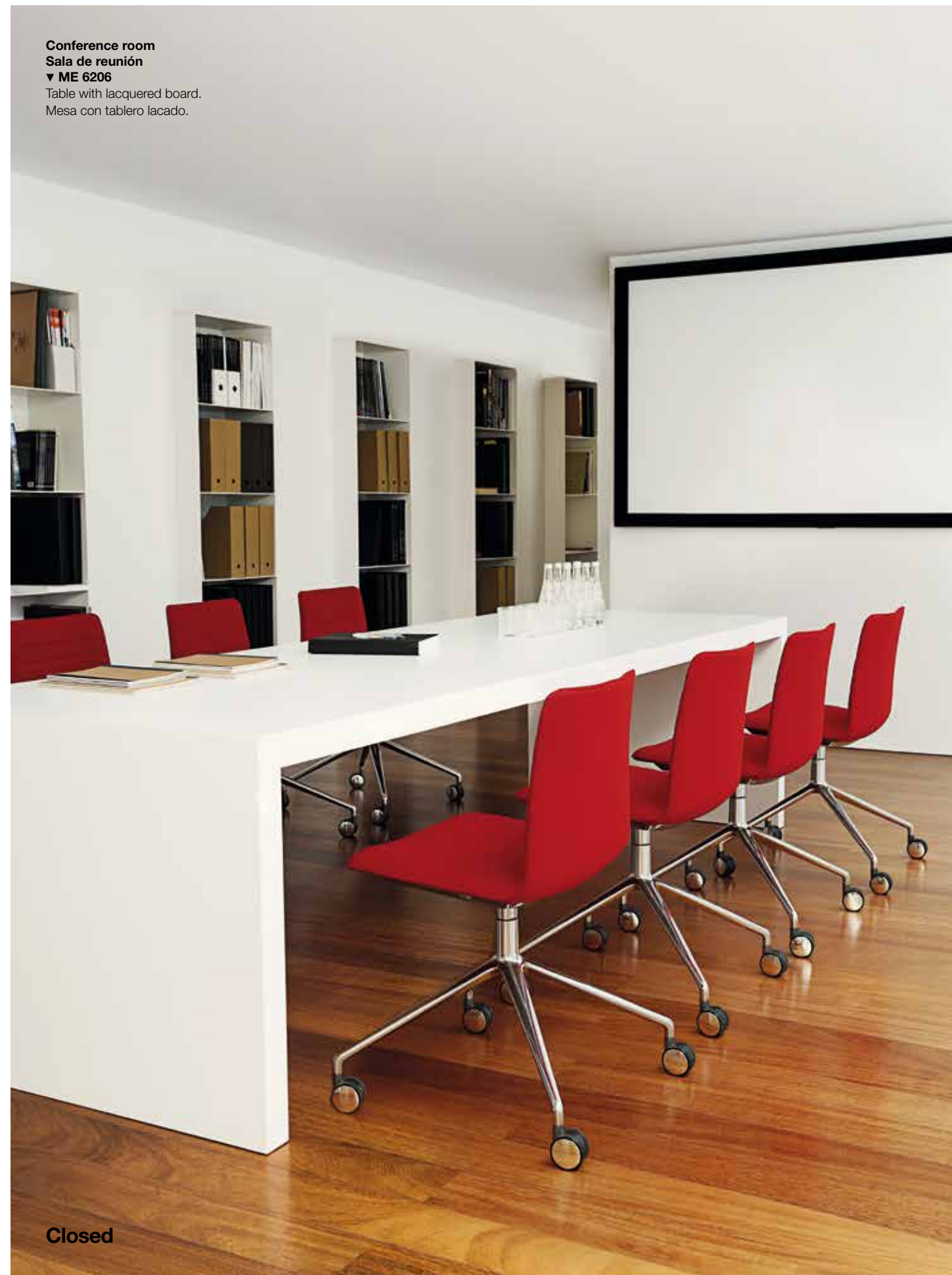
Table with lacquered board. Mesa con tablero lacado.