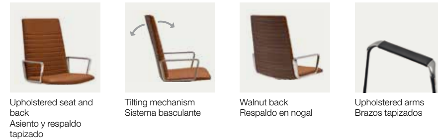
Upholstered seat and back Asiento y respaldo tapizado